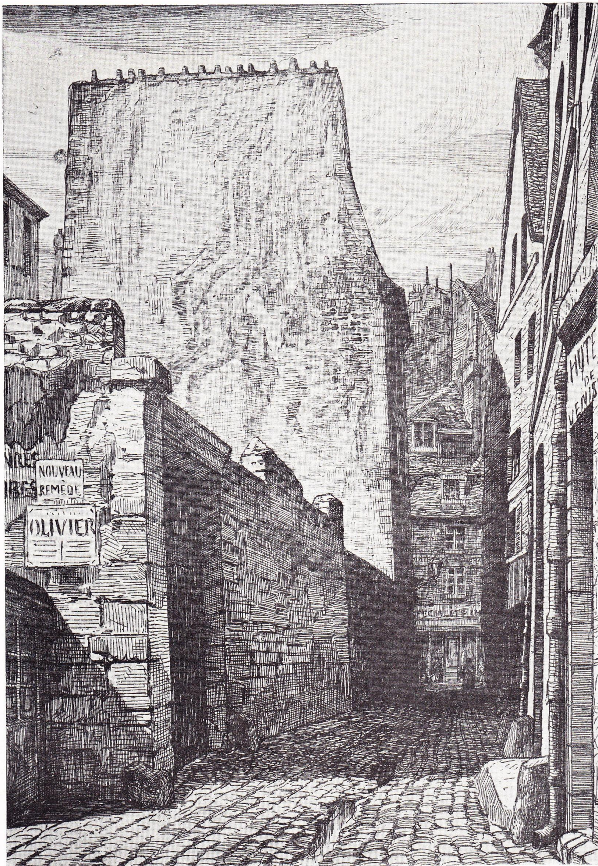
RUE SAINT-JULIEN-LE-PAUVRE EN 1863.

D'après une eau-forte de MARTIAL — (Collection G. Olive.)